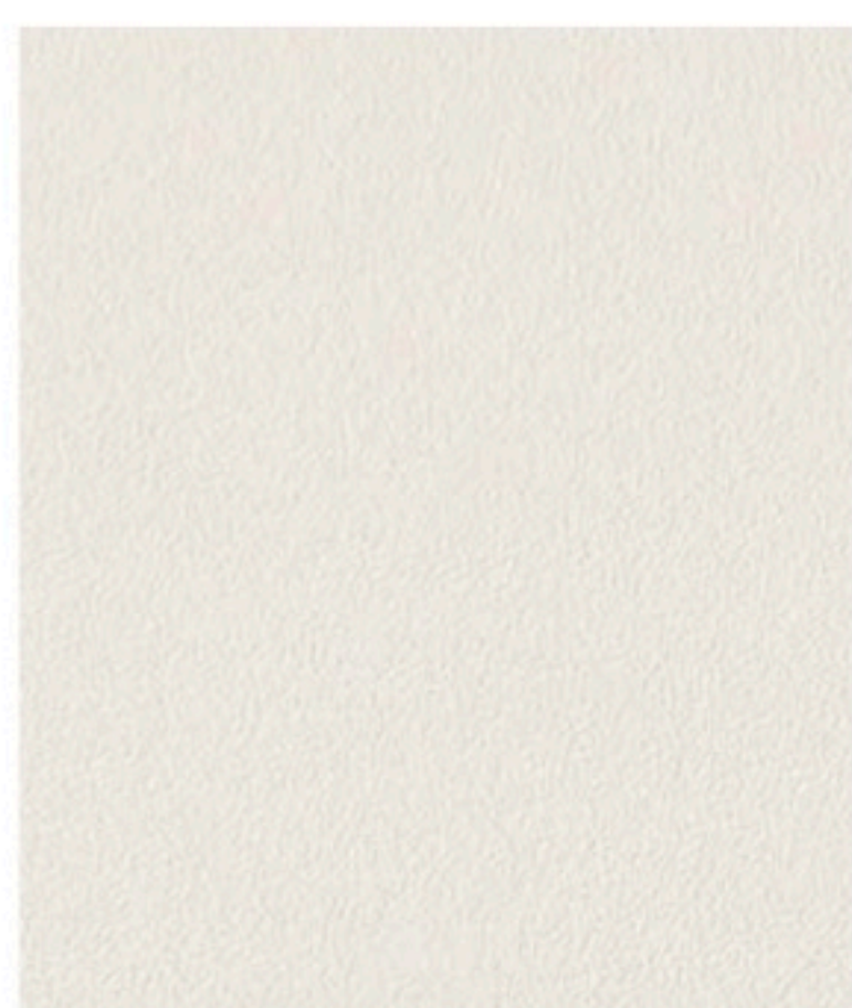
Cold Beige 270 x 29,5 cm