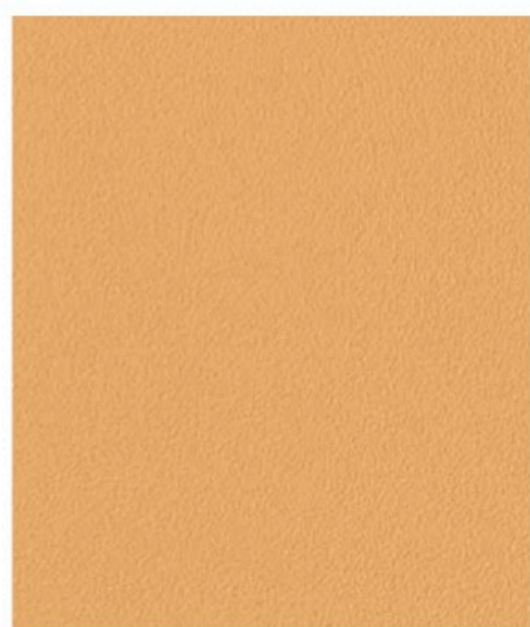
Mustard Yellow 270 x 29,5 cm