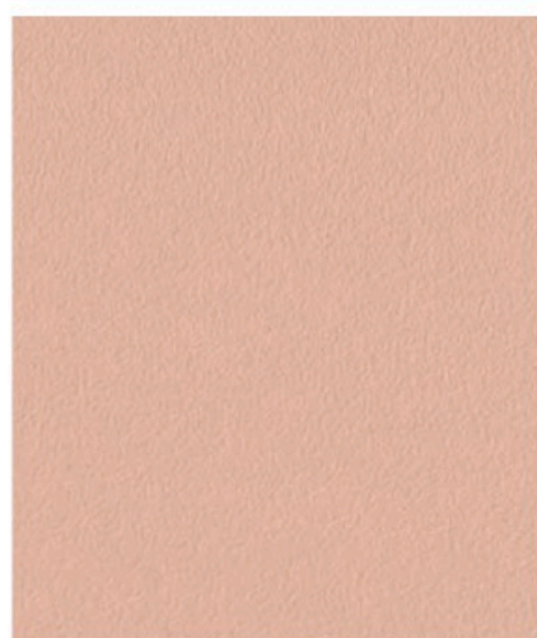
Pastel Pink 270 x 29,5 cm