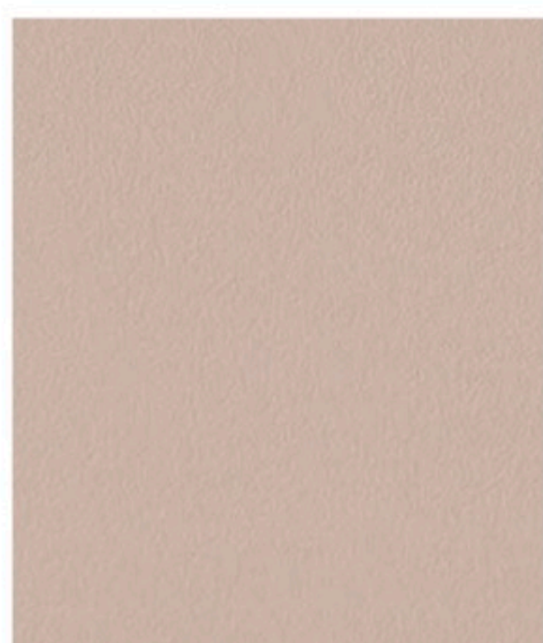
Warm Taupe 270 x 29,5 cm