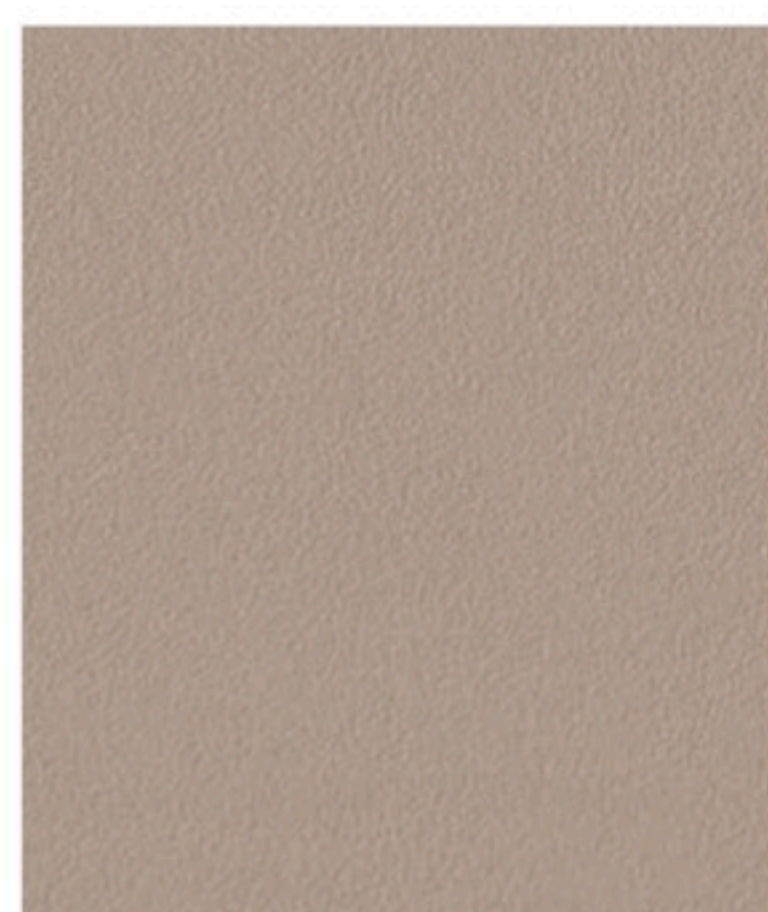
Deep Warm Taupe 270 x 29,5 cm