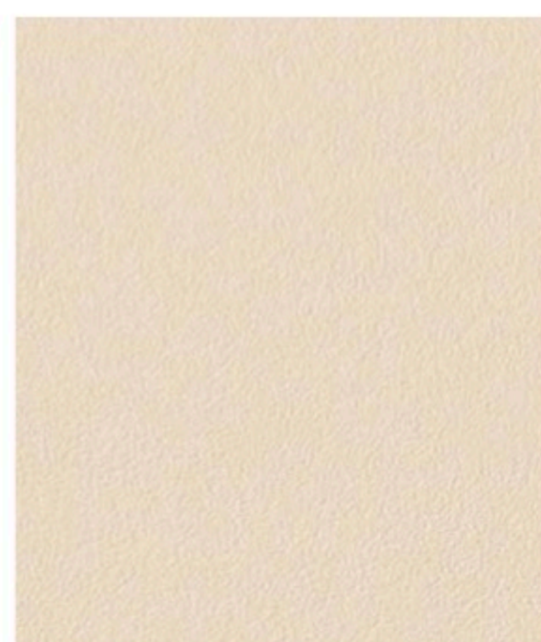
Dark Beige 270 x 29,5 cm